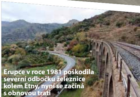
Erupce v roce 1981 poškodila severní odbočku železnice kolem Etny, nyní se začíná s obnovou trati