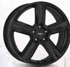
DEZENT KG black 17", 18", 19"