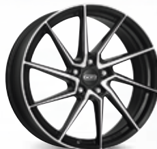
DOTZ Spa dark 17", 18", 19"