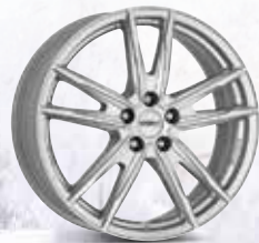
DEZENT KF silver 16", 17", 18", 19"