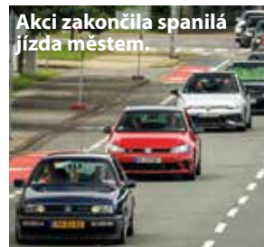
Akci zakončila spanilá jízda městem.