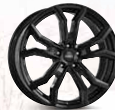
DEZENT TV black 16", 17", 18", 19", 20"