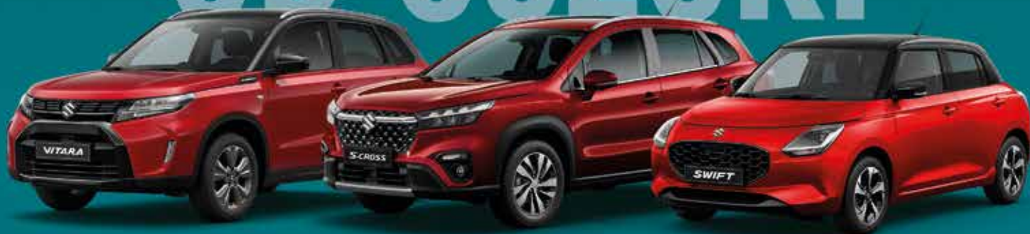
Suzuki Vitara praktické SUV