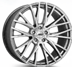
AEZ Panama high gloss 19", 20", 21"