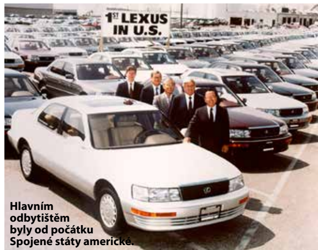
Hlavním odbytíštěm byly od počátku Spojené státy americké.

Když se v roce 1989 na trh dostal Lexus LS400, nebyl to jen další luxusní sedan – byl to přímý výstřel na zavedené automobilové giganty, zejména německé značky Mercedes-Benz a BMW. Lexus, nově založená luxusní značka pod patronátem Toyoty, si dal ambiciózní cíl překonat německé výrobce nejen na domácím japonském trhu, ale i na mezinárodní úrovni. LS400 nepředstavoval pouhý pokus držet krok s konkurencí, ale usiloval o kompletní redefinici toho, co luxusní sedan může nabídnout.