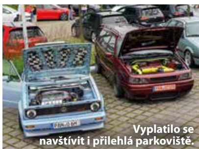
Vyplatilo se navštívit i přilehlá parkoviště.

Hlavním mecenášem GTI Treffen byl samotný Volkswagen, který, stejně jako Škoda nebo SEAT, každoročně