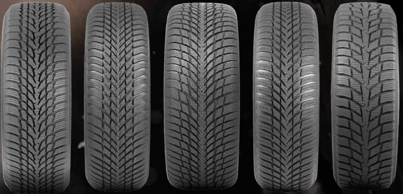
NOKIAN TYRES SNOWPROOF 1