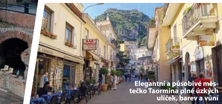
Elegantní a působivé městečko Taormina plné úzkých uliček, barev a vůní

Od jeho horní stanice lanovky míří pěší stezka až k vrcholu. Do blízkosti Etny také vede okružní úzkorozchodná železnice postavená koncem 19. století a zajíždí sem zajímavý turistický vlak. Jeho nejvyšší stanice je však ve výšce jen 924 m n. m.