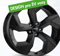
DEZENT AO black 19", 20"