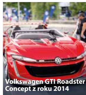
Volkswagen GTI Roadster Concept z roku 2014