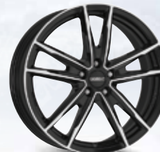
DEZENT KF dark 16", 17", 18", 19"