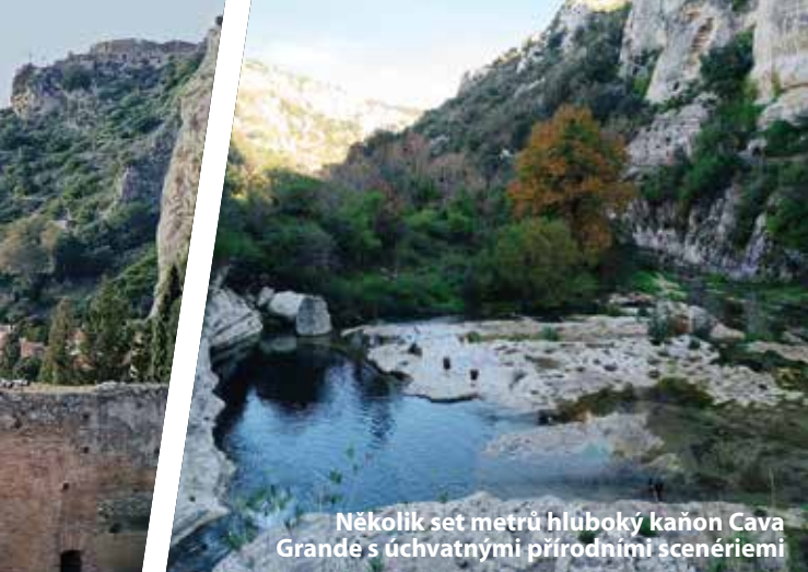
Několik set metrů hluboký kaňon Cava Grande s úchvatnými přírodními scenériemi