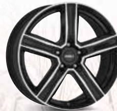
DEZENT KG dark 17", 18", 19"