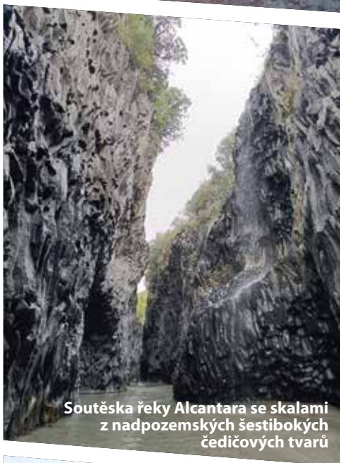
Soutěska řeky Alcantara se skalami z nadpozemských šestibokých čedičových tvarů