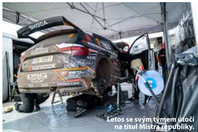
Letos se svým týmem útočí na titul Mistra republiky.