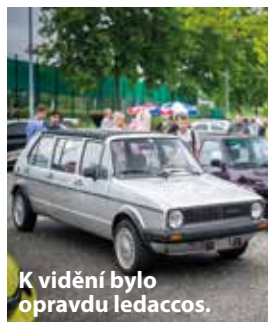
K vidění bylo opravdu ledaccos.